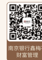
南京银行鑫梅花 财富管理