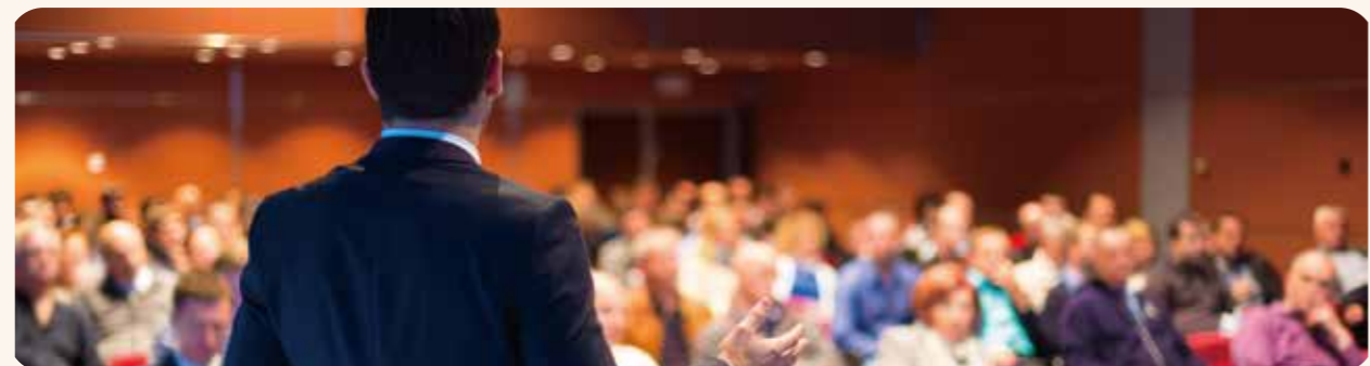
● 财富类专项主题沙龙