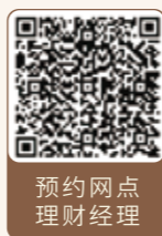
预约网点 理财经理

南京银行持续深化机构战略布局。自2007年设立第一家分行以来, 跨区域经营不断推进, 先后设立了泰州、上海、无锡、北京、南通、杭州、扬州、苏州、常州、盐城、南京、镇江、宿迁、连云港、江北新区、徐州、淮安17家分行, 实现布局京沪杭及江苏省内设区市全覆盖。